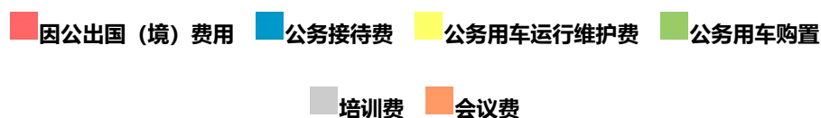
图 3、“三公”经费、培训费、会议费支出预算构成